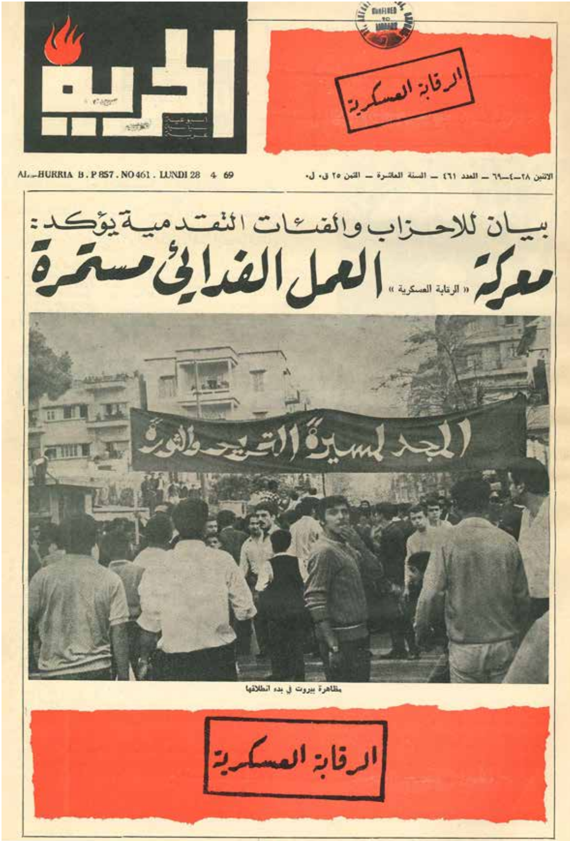
“The Battle for Feda’iyeen Activity Continues”