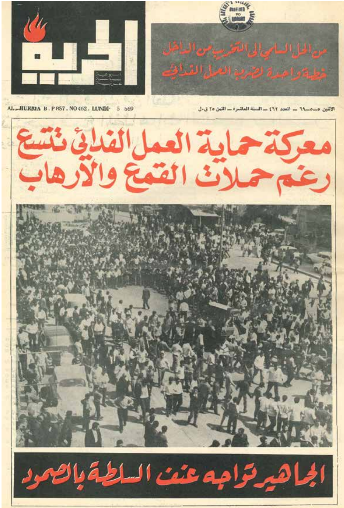
“The Battle to Protect the Feda’iyeen Continues to Gain Ground in Spite of Supression”