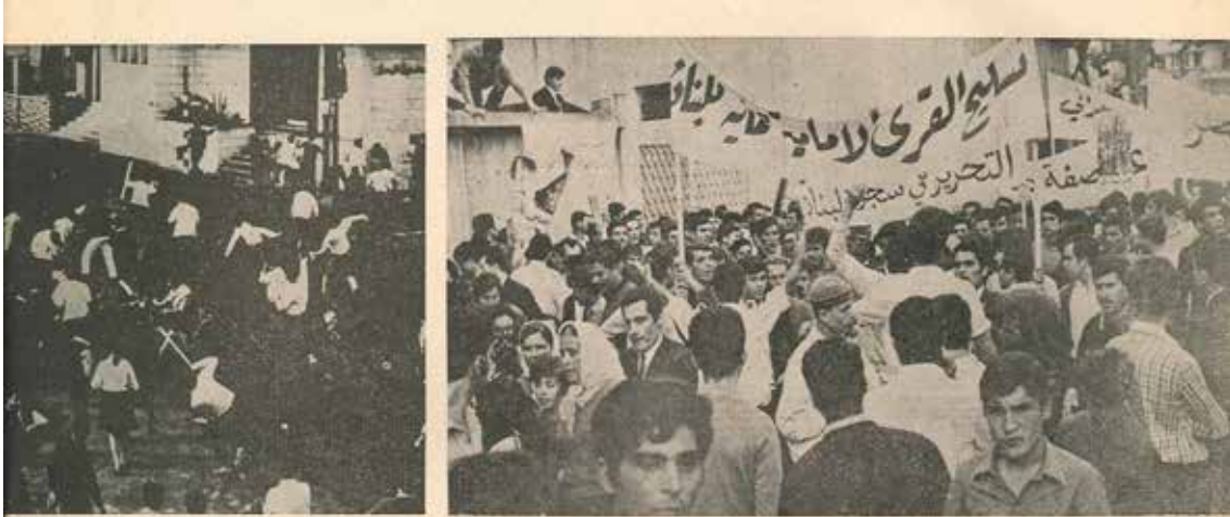
المشاهرون يذمّون عن التسميم بالحجارة